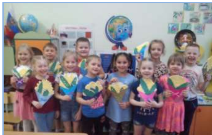
Группа № 12

Ближних и родных людей поздравлять не забываем!