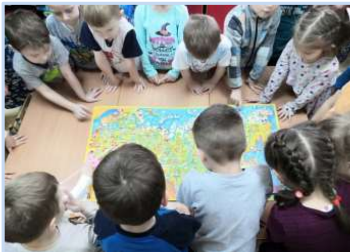
Группа № 9

А самое главное, мы узнали, что такое карта и как по ней ориентироваться, рассматривали карту России и карту Ярославской области. Научились играть в «морской бой» и использовали этот метод для поиска городов на карте.