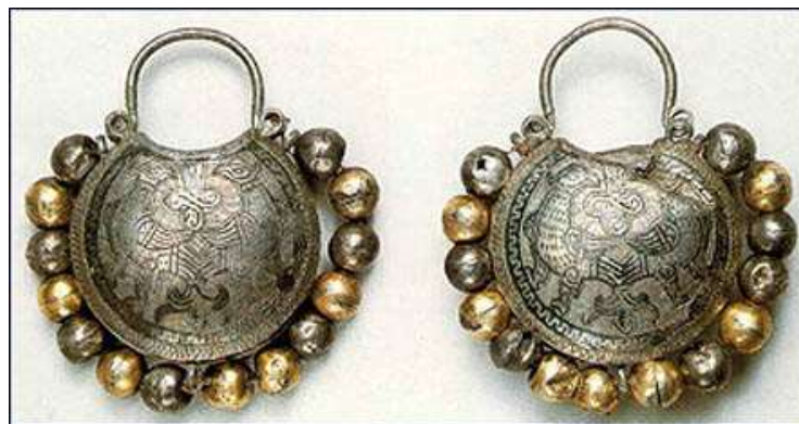
Женские серьги- колты