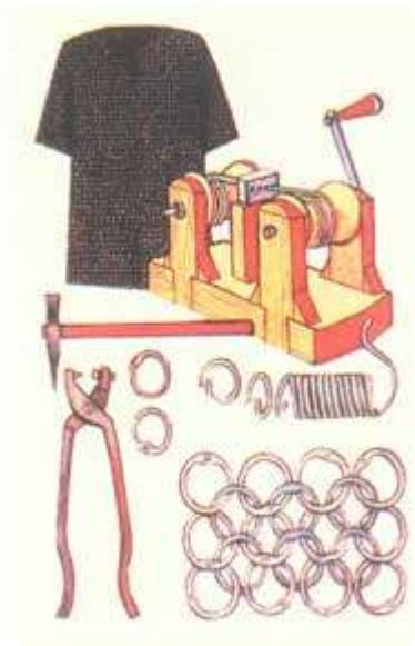
Кольчуга (схема изготовления)

Кольчуга-доспех, сплетённый из железных колец, металлическая сеть для защиты от поражения про- тивником.