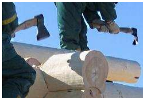
Топор в руках мастеров