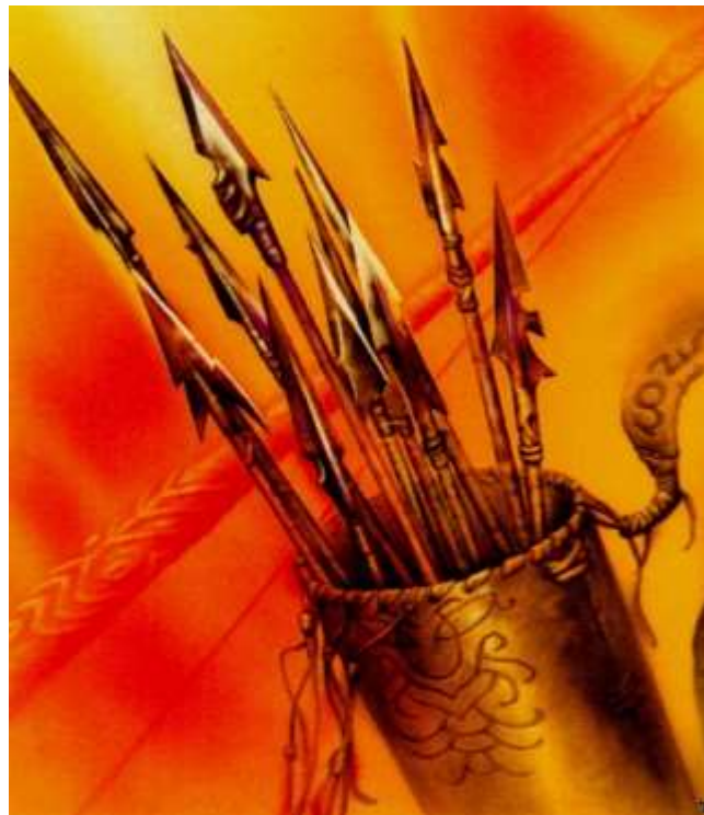
Колчан и стрелы