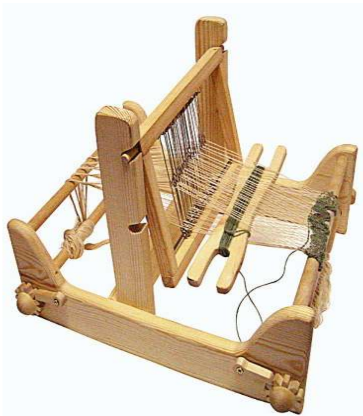
Ручной ткацкий станок