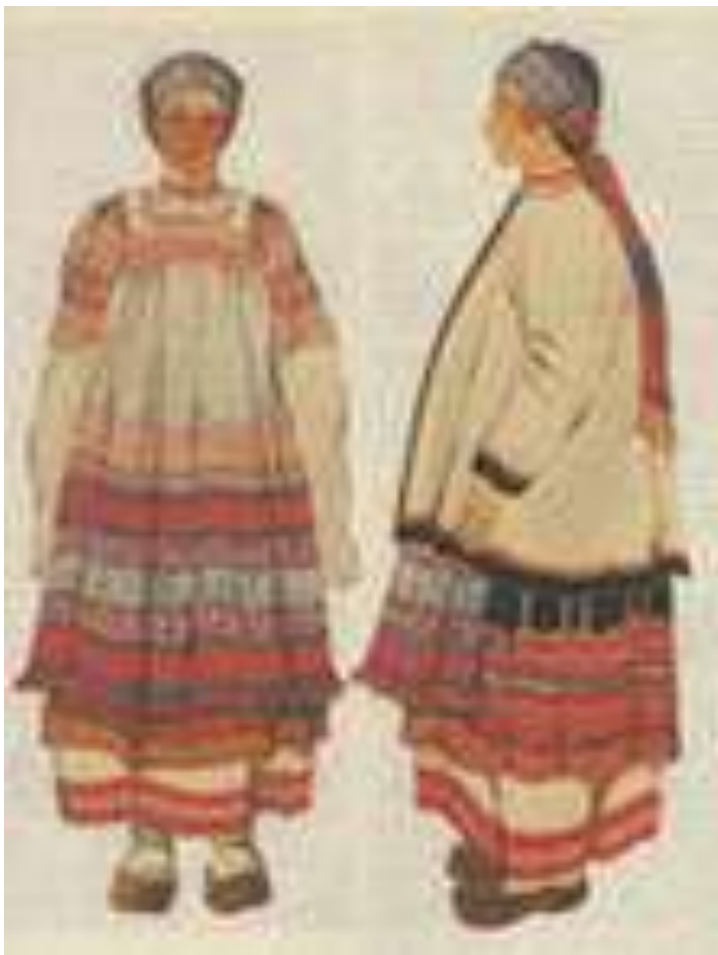
Узорное ткачество. Тульский костюм с сарафаном