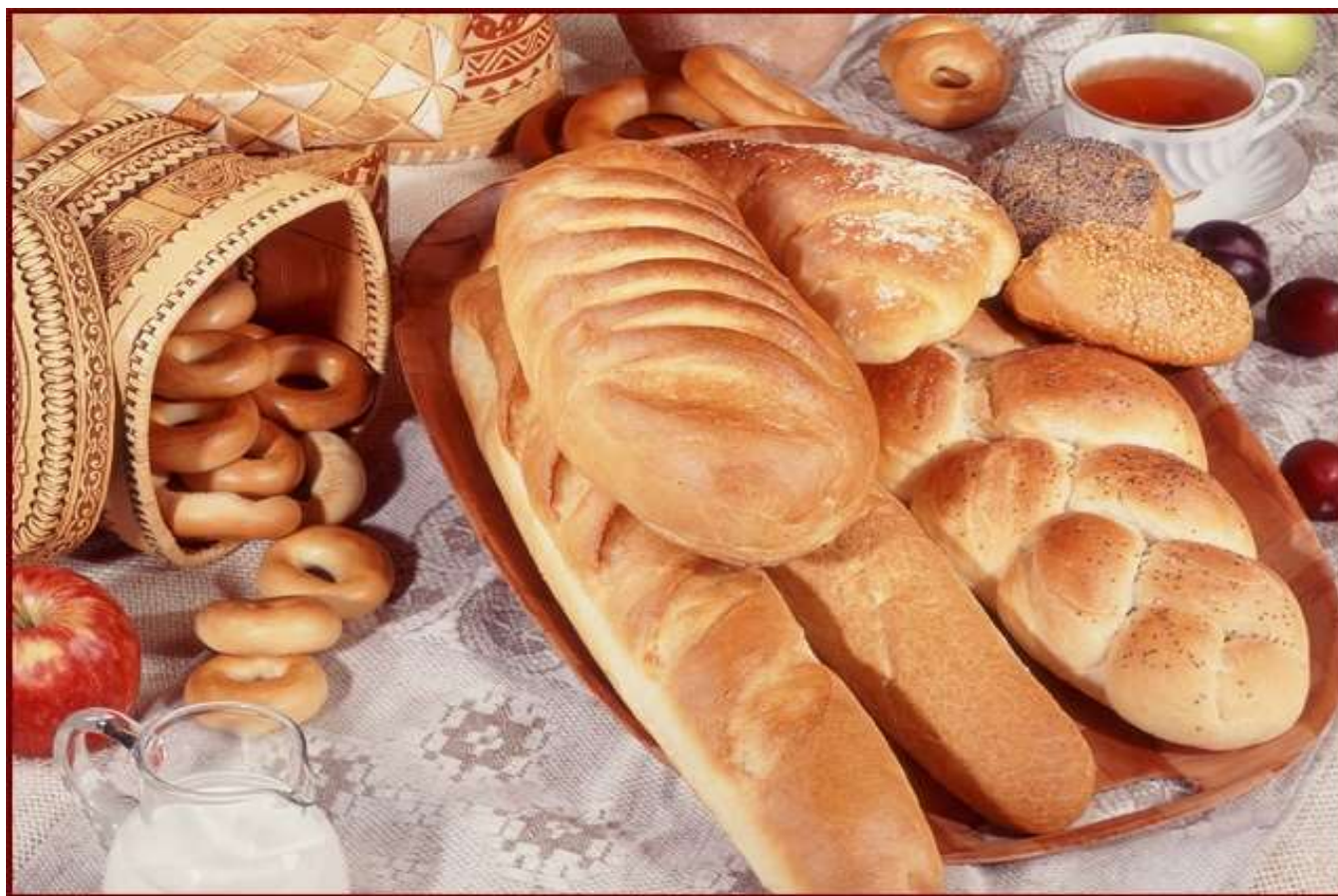
Хлеб , хлебные изделия