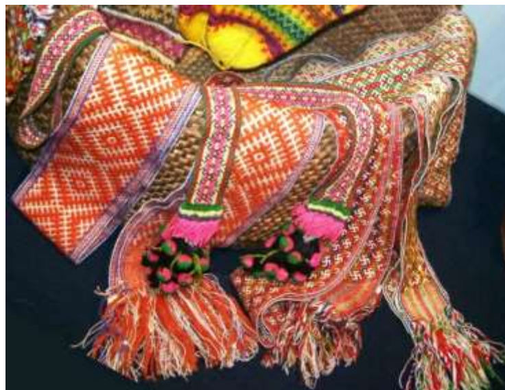
Узорное ткачество . Пояс