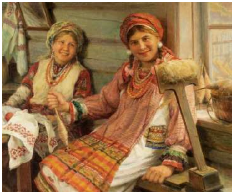
Ф.В.Сычков, «Две молодые ткачихи»

Кроме гладкой холстины деревенские мастерицы выполняли и ткани с узором. Техника тканья при этом усложнялась. Материалом для ткачества служила пряжа, которую получали из льна и конопли, а также из овечьей и козьей шерсти. Пряжу часто окрашивали домашним способом в разные цвета и тогда узорные ткани получались особенно нарядными.