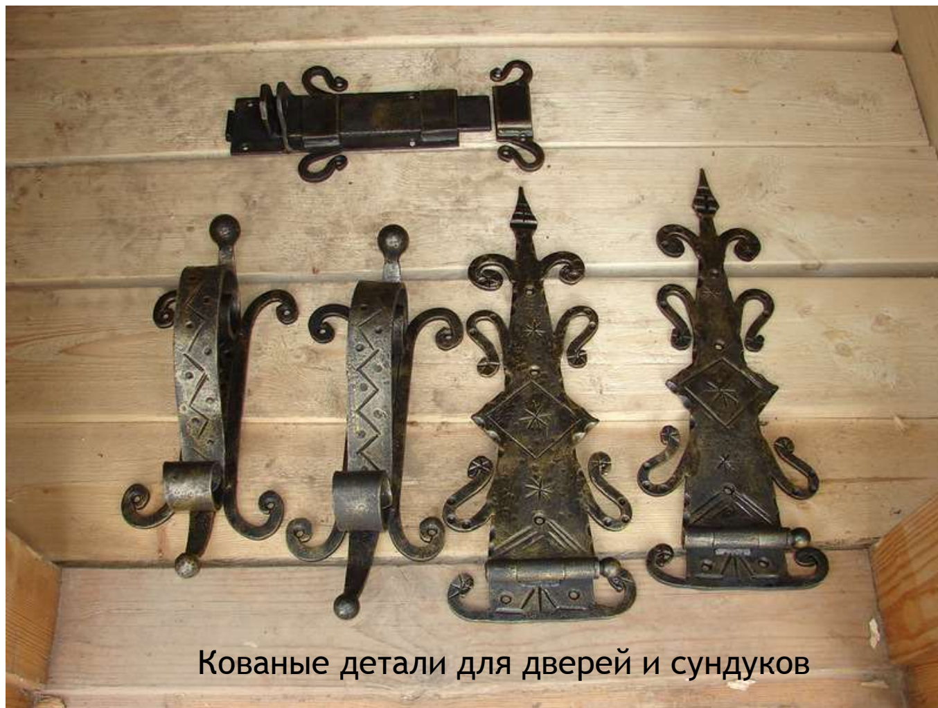
Кованые детали для дверей и сундуков