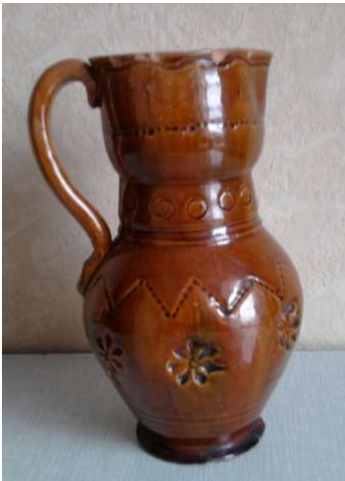
Старинный глиняный кувшин