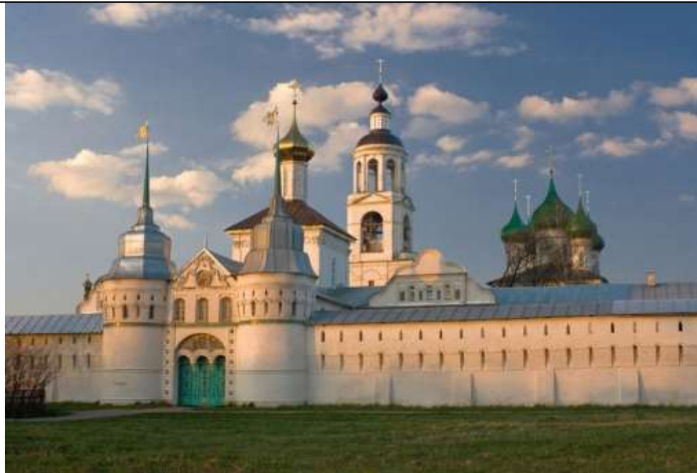
Ярославский историко-архитектурный и художественный музей-заповедник (кремль) (Спасо-Преображенский монастырь)