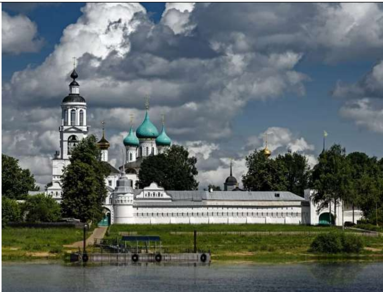
Свято-Введенский Толгский женский монастырь