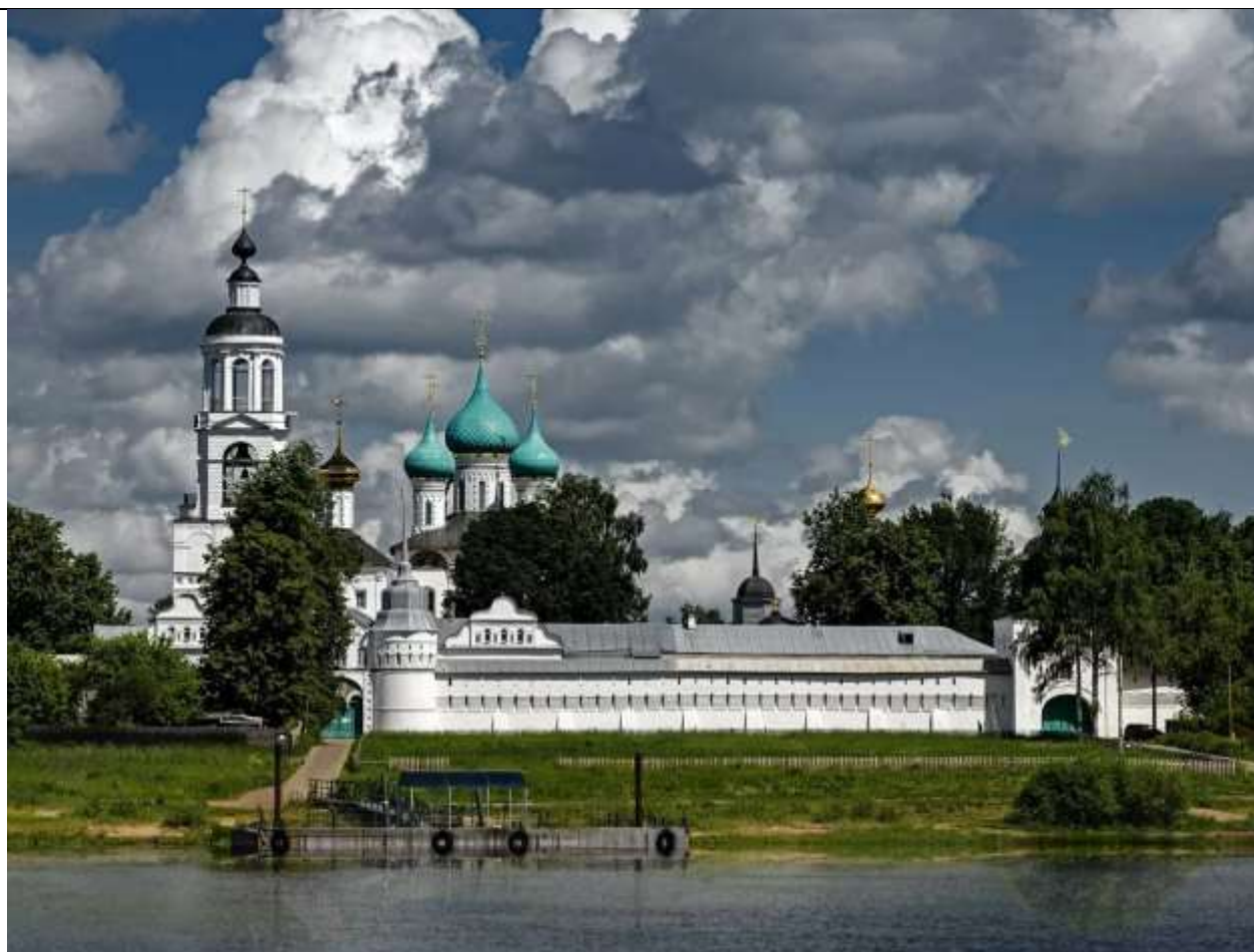
Свято-Введенский Толгский женский монастырь