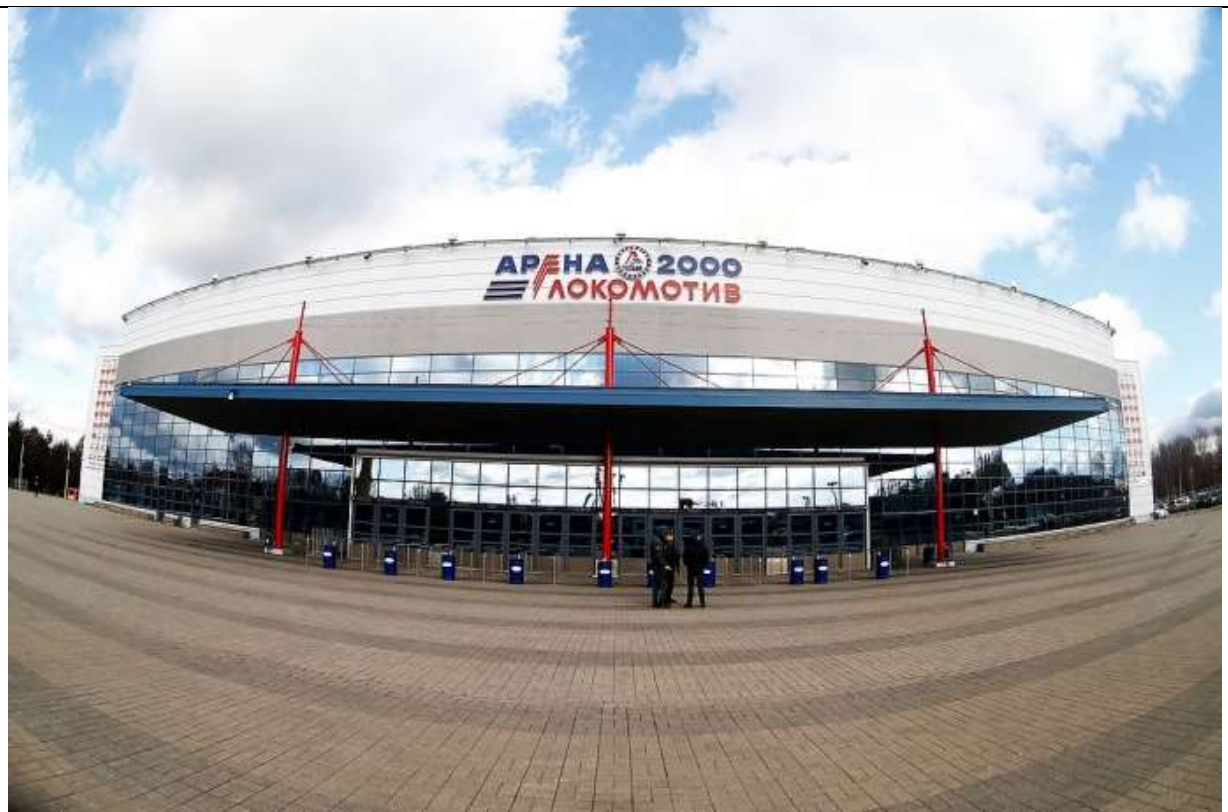
Арена – 2000 Локомотив