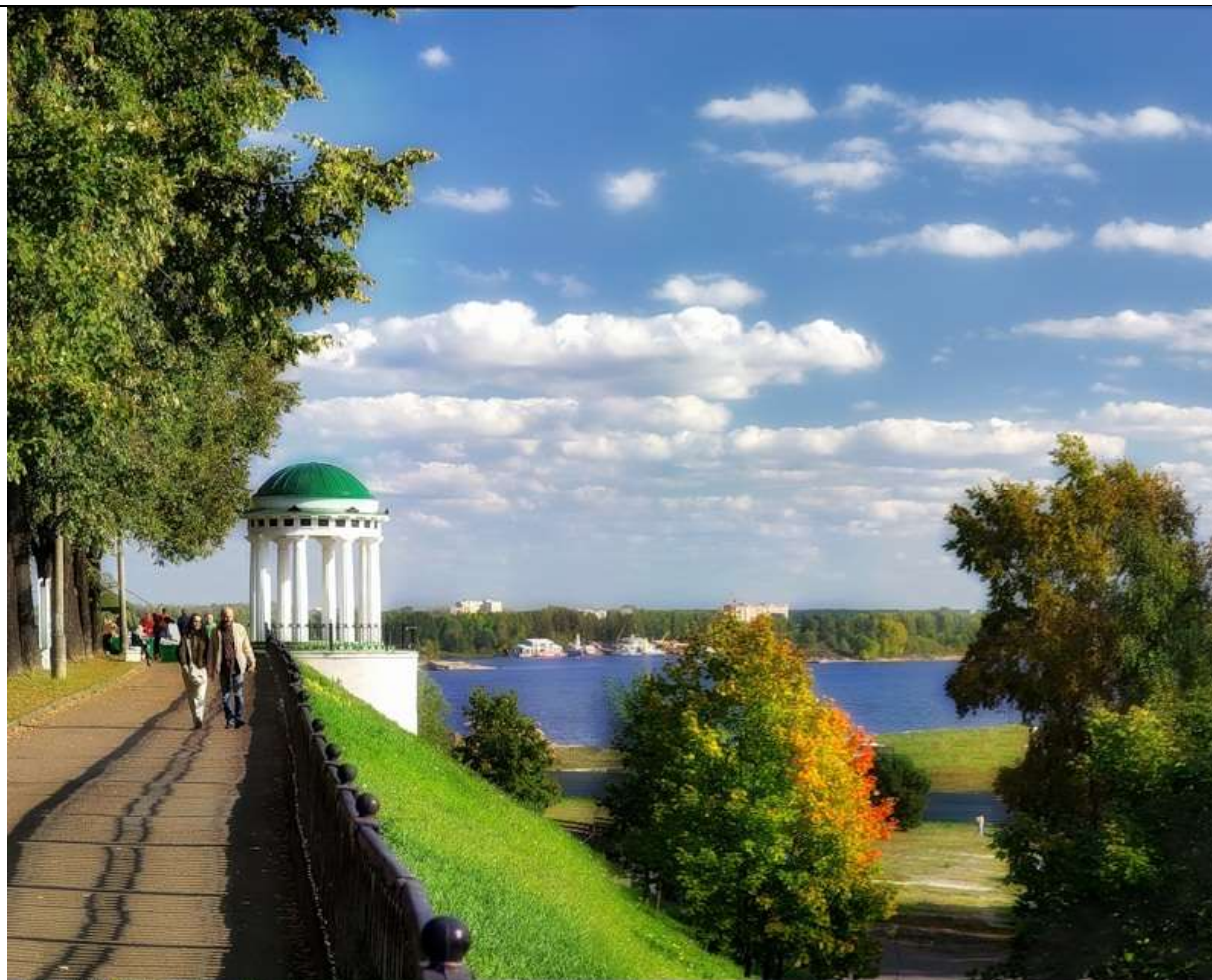
Набережная и беседка