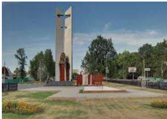
Памятник-монумент «Вечный огонь»