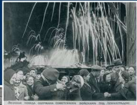
Белая победа одержана советскими войсками под Ленинградом

Победе радовалась вся страна, но эта радость была со слезами на глазах, так как в каждой семье, в каждом доме кто-то погиб на этой страшной войне.