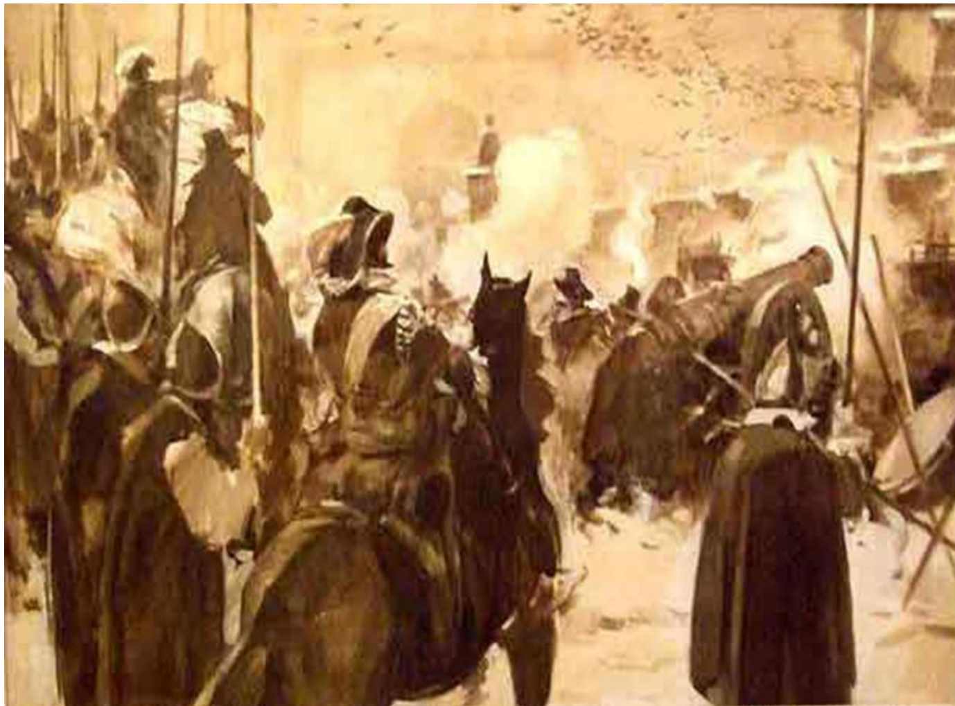
Обстрел Троицкого монастыря.