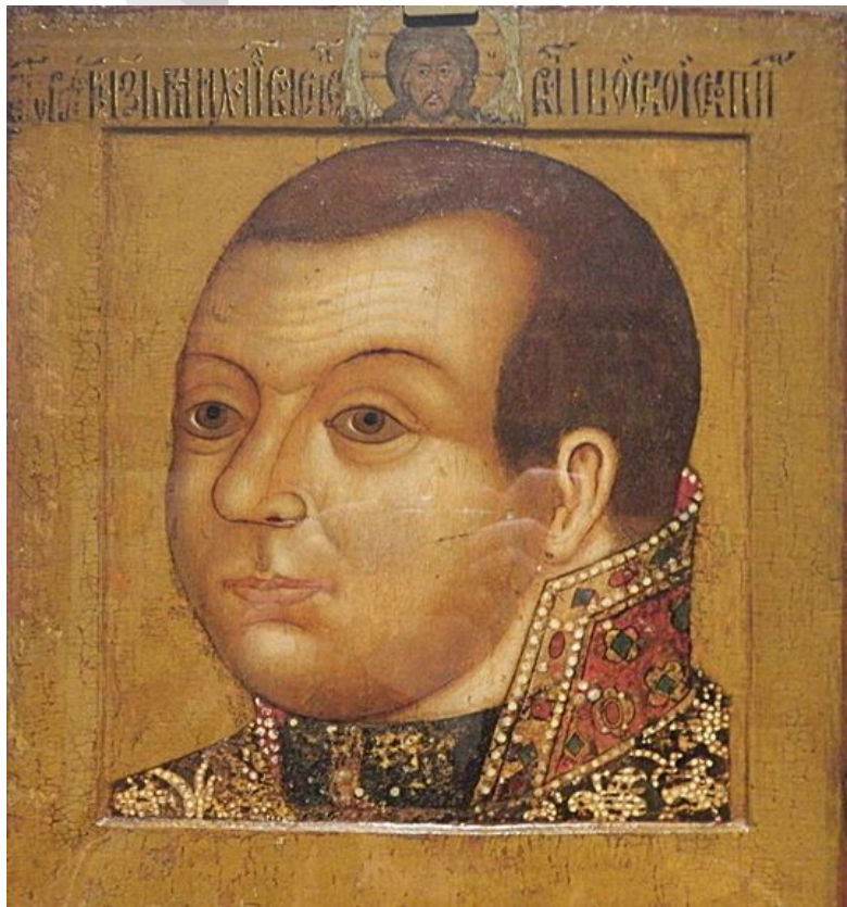
Парсуна Михаила Скопина-Шуйского