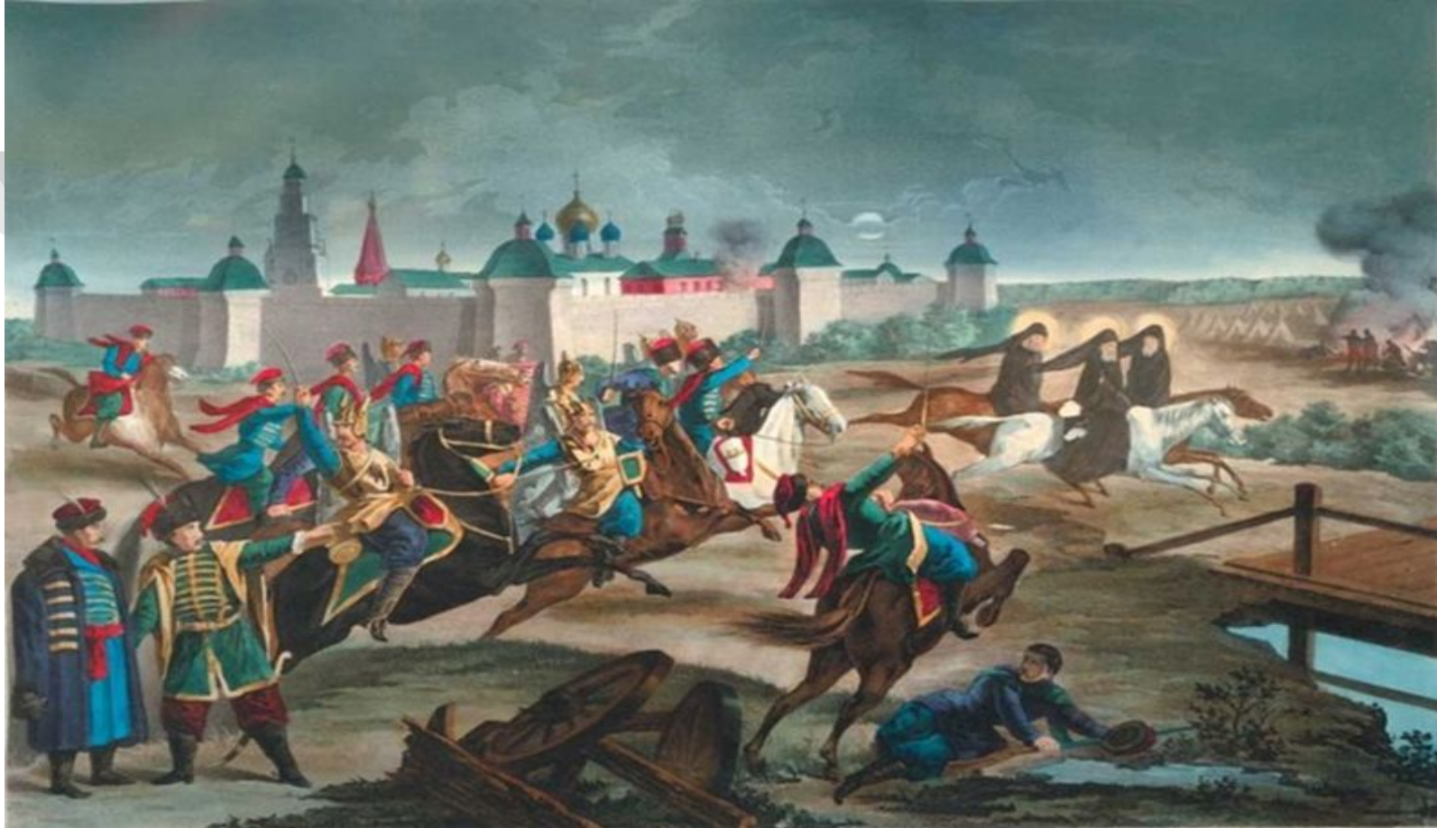
Монахи прорываются сквозь осаду и скачут к князю Михаилу Скопину-Шуйскому за помощью