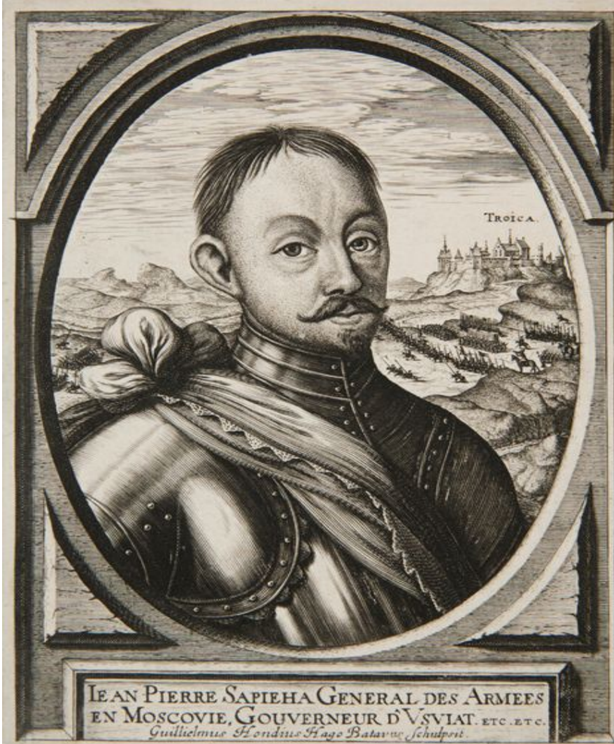
Гетман Ян Сапега

JEAN PIERRE SAPIEHA GENERAL DES ARMEES EN MOSCOVIE, GOUVERNEUR D'VSVIAT. ETC. ETC. Guiljelmus Hondius Hago Batavus Schulpes.