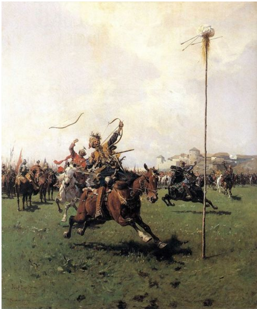
Лисовчики, упражняющиеся в стрельбе из лука.