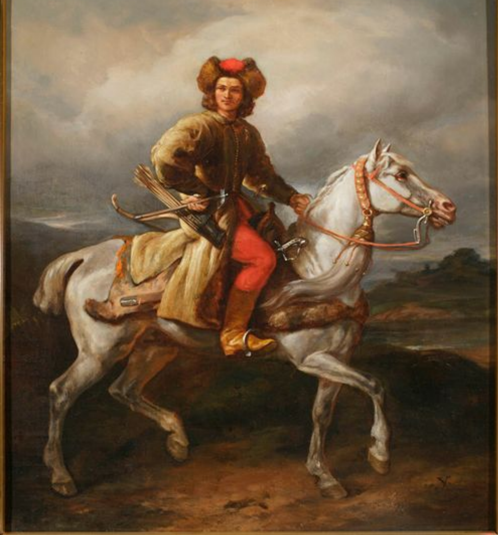
Лисовчик. Ю. Коссак