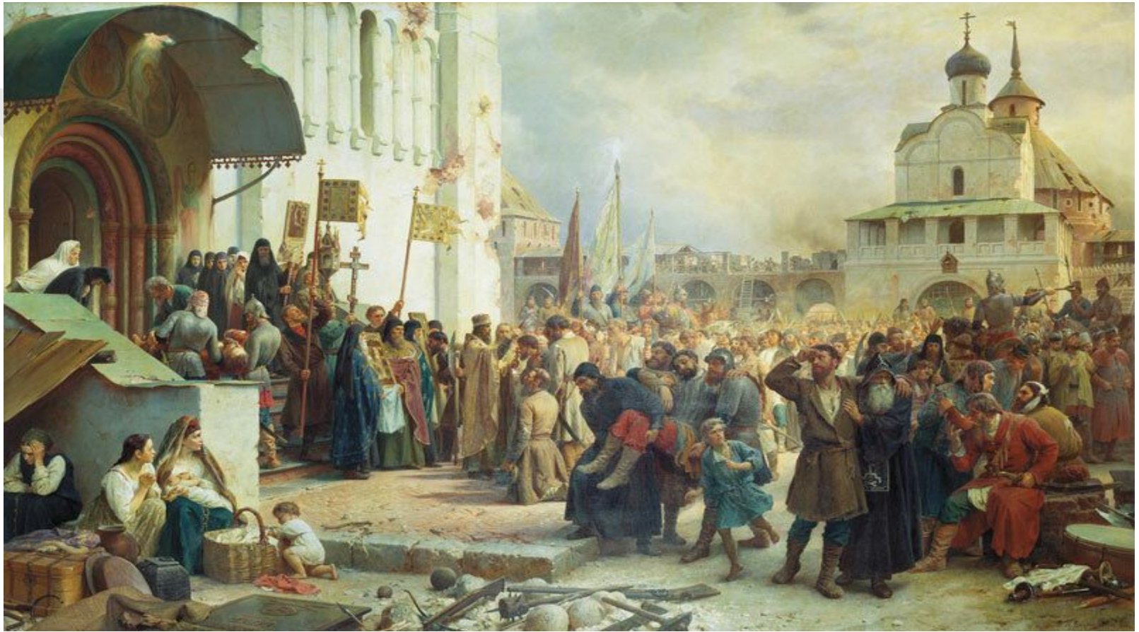
Осада Троице-Сергиевой лавры. В. Верещагин