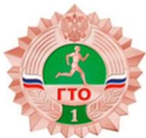
БРОНЗОВЫЙ ЗНАК ОТЛИЧИЯ