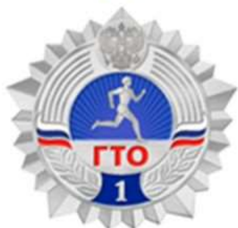
СЕРЕБРЯНЫЙ ЗНАК ОТЛИЧИЯ