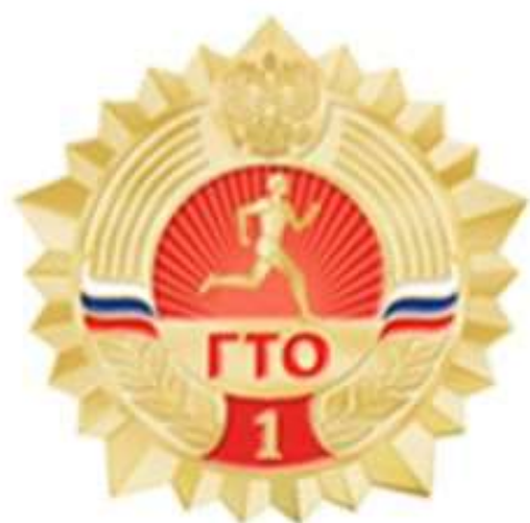
ЗОЛОТОЙ ЗНАК ОТЛИЧИЯ