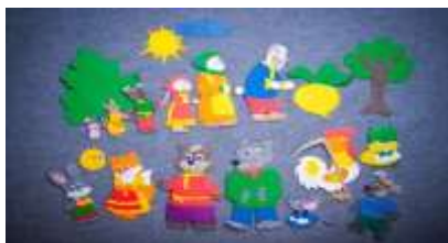
Театр на фланелеграфе